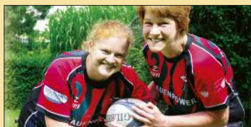
Frauen, die gerne raufen! S. 22-23

Hinweise zur Broschüre: Tel. 030/69 20 21 05 E-Mail: info@hohen-neuendorf-internet.de