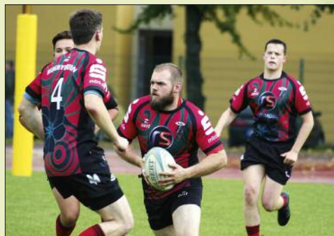
■ Das Ringen ums Rugby-Ei hat in Hohen Neuendorf jetzt 20 Jahre Tradition.