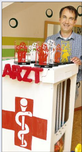
Viermal haben Teilnehmer aus Hohen Neuendorfer an dem internationalen jährlichen Wettbewerb teilgenommen und jedes Mal gewonnen!

Der Hochschul-Professor hat es sich zur Aufgabe gemacht, in seiner Freizeit Kindern Lust auf Naturwissenschaften zu machen. Dafür hat er 2007 den Verein „Uni4Kids“ gegründet. „Wir wollten ursprünglich ein Science Center einrichten und hatten als Standort bereits den Bahnhof Birkenwerder aus-