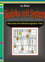
Wandlitz: Ino Weber