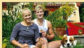
Gold-Ruderer verliebt! S. 6-7