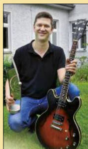
Gefragt mit leisen Tönen S. 12-14