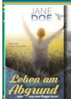
Bernau: Jane Doe