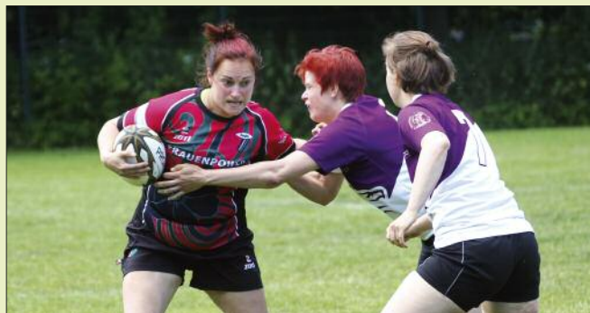
Frauen, die gerne raufen!