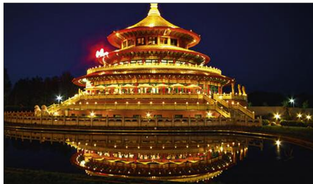
■ Die Himmelspagode bringt uns das Reich der Mitte auf kulinarische Weise nahe.

Es lohnt sich, immer wieder mal die Internetseite aufzurufen, denn dort gibt es oft besonders attraktive Aktions-Angebote.