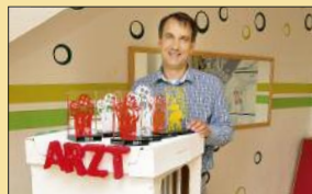
Theater für die Wissenschaft S. 28-30